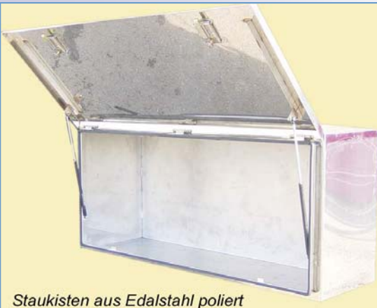
Staukisten aus Edalstahl poliert

Werkzeugkiste 1250x500x550mm, Art.Nr. FEL 3663 275,00€ Werkzeugkiste 1000x400x400mm, Art.Nr. FELRI1000 265,00€ Werkzeugkiste 620x300x950mm Art.Nr. FELRI01152502 260,00€ Werkzeugkiste 1350x400x400 Art.Nr. FELRI2200085 290,00€