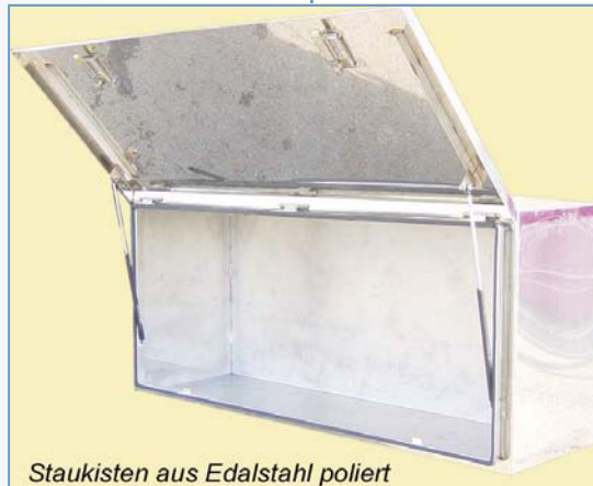
Staukisten aus Edalstahl poliert